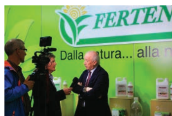
Fertenia al Vinitaly: Intervista dopo i risultati della sperimentazione del Progetto VI.SO.

*PREVIEN: Miglior induttore di resistenza tra le strategie a confronto nei tre anni di sperimentazione del Progetto VI.SO. sia applicato da solo che in combinazione con rame.